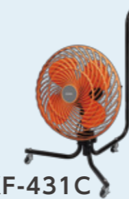
KF-431C 【キャスタータイプ】

独自設計のサーキュレーション送風で約20%の風速アップを実現しました。スパイラル気流により直進性が高く風を遠くへ届けます。*