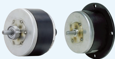
ZHA 形クラッチ ZHY 形ブレーキ