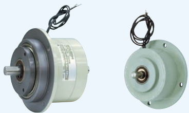
ZKG-AN 形クラッチ ZKG-YN 形ブレーキ