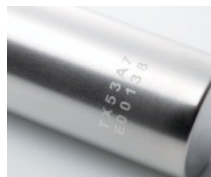
電池ケース(曲面印字)