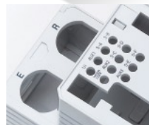
樹脂成型品(段差印字)