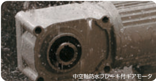
中空軸防水ブレーキ付ギアモータ