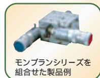
モンブランシリーズを 組合せた製品例

モンブランシリーズの優れた品質は、 管理された生産体制と確実な検査 体制によって、裏付けられています。