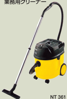
NT 361 Eco