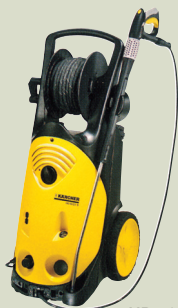
HD 10/22 S