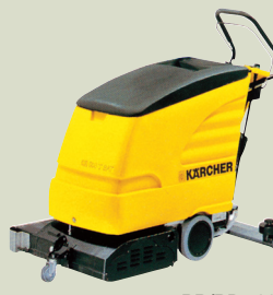
BR/BD 530 BAT