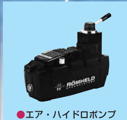
● エア・ハイドロポンプ