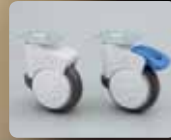
デザインキャスター