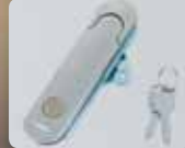
スイングハンドル