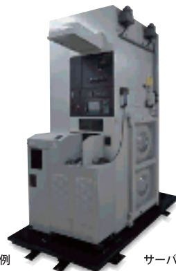
半導体製造装置施工例

最大3000kgf/m 2 までの重荷重に対応でき、サーバーや精密機器、美術品など大切な資産を地震から守ります。またサーバールームやオペレーションセンターなどフロア全体の免震も可能です。