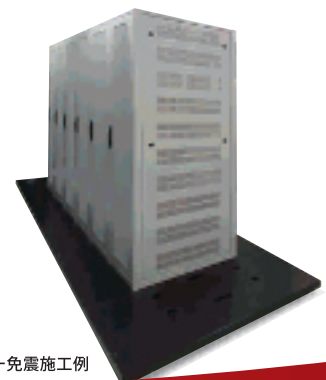
サーバー免震施工例