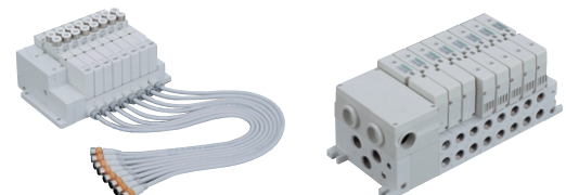
MW4G \frac{B}{Z} 4-R1