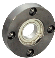
BCR型 (Fe 3 O 4 )