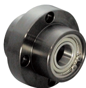
DCI型 (Fe 3 O 4 )