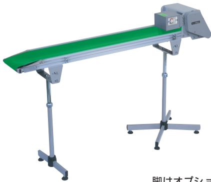
脚はオプションです。