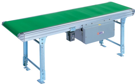
脚はオプションです。