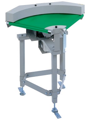
フリックタッチカーブFTB形