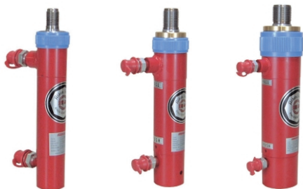
MD05-100 MD1-100 MD2-100