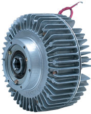
ZA-AN 1 形