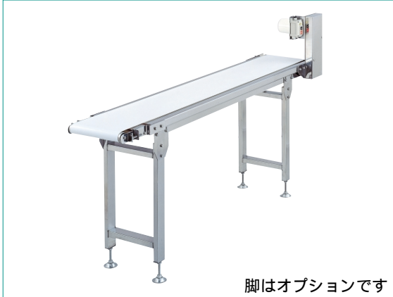
脚はオプションです