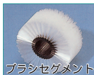
ブラシセグメント

液晶板の洗浄、パレットのサイド・底部・内部のクリーニング、コンベア間の落下防止及び受渡し、袋包装の空気抜き、フィルム上のゴミ除去、製品に付着した切粉などの異物除去、ジャガイモやニンジンなどの皮のはがし、ステンレストレーの洗浄。