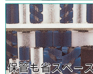
保管も省スペース