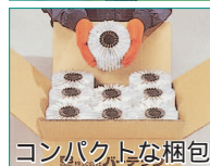
コンパクトな梱包