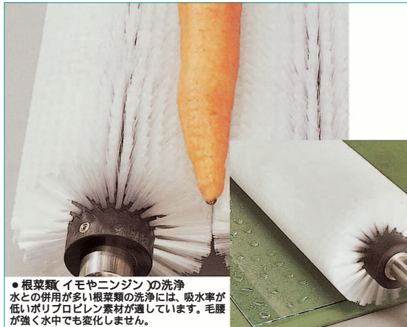
●根菜類(イモやニンジン)の洗浄 水との併用が多い根菜類の洗浄には、吸水率が低いポリプロピレン素材が適しています。毛腰が強く水中でも変化しません。