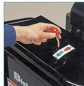
シンプルなレバー操作で上昇、下降はワンタッチ。昇降スピードはレバーを倒す角度に応じた可変式です。