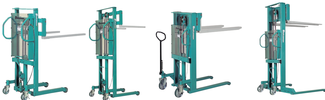
STS15 STL25 STL65( ミドルマストタイプ650kg中量級タイプ ) ST30WW( アウトリガータイプ )