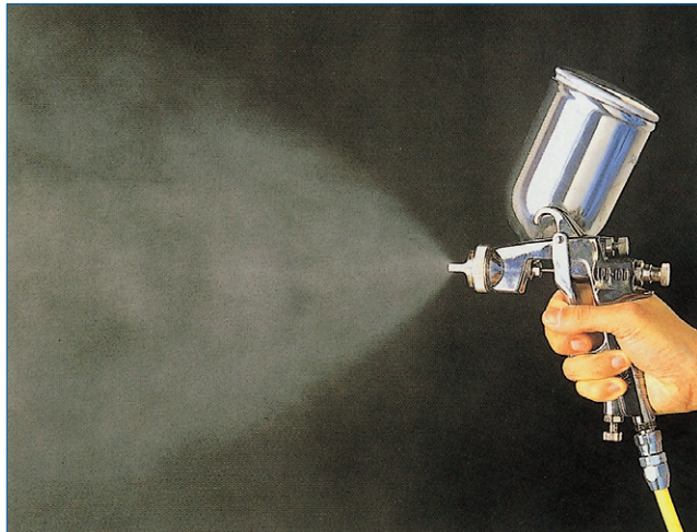
低圧スプレーガン

環境保全面から、吹付空気(ガン手元)圧力を0.05MPa低減させ、従来機と同等以上の微粒化性能を引き出しました。また、従来のスプレーガンでは、微粒化が難しいとされた環境対応形塗料(水性塗料など)にも適合します。