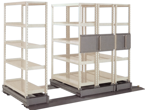
軽中量ラックタイプ 最大積載質量200kg/段